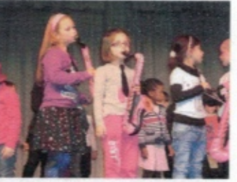
Les élèves chantent souvent leur leur travail de répétition.