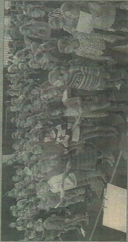
Les enfants fréquentant les écoles primaires de Montigny bénéficient de cette activité.