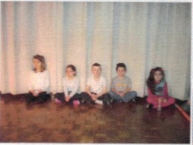
Les élèves chantent souvent leur leur travail de répétition.