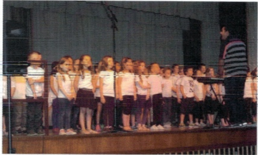
Six classes sur la scène de la salle Schuman.

La douzième édition des concerts scolaires de Montigny-lès-Metz se déroulait sur la scène de l'Espace Europa Courcelles. Aux commandes, Momtez Sridi, musicien intervenant de l'EMARI, et les enseignants respectifs des écoles Cressot, Giraud, Marc-Sangnier. Pour l'occasion, six classes étaient réunies.