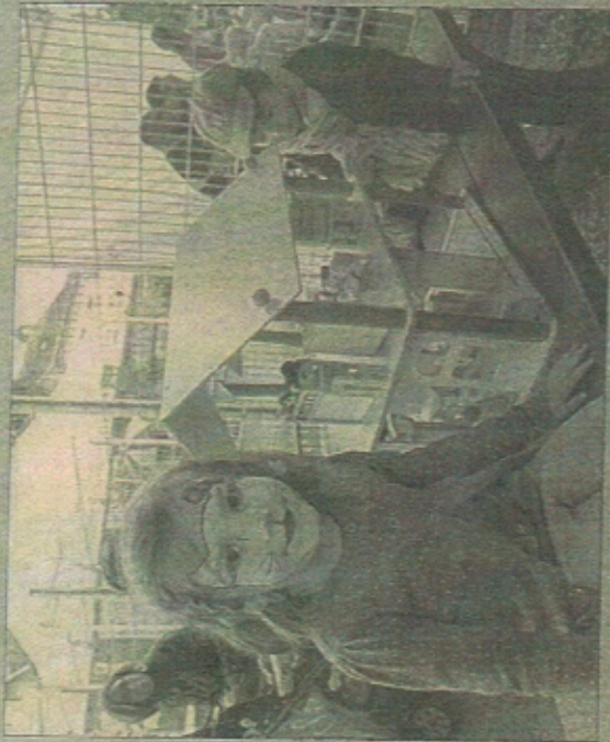
Venez à la fête de la petite enfance samedi 5 septembre.

Lors de cette journée découverte, de nombreux ateliers seront ouverts pour distraire les enfants : manège, pêche, maquillage, jeux gants, poneys, contes, musiques, marionnettes (avec la compagnie Lavifil), et même un atelier terre et plantation.