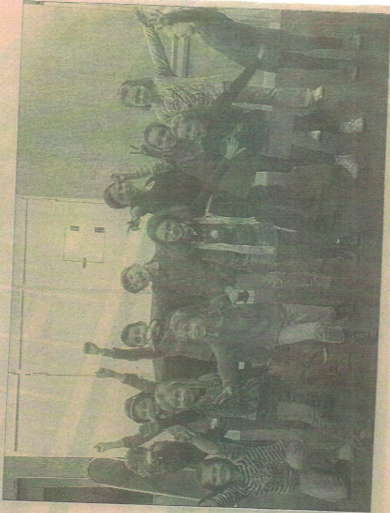
Périscolaire musical à Montigny-lès-Metz : une belle initiative.