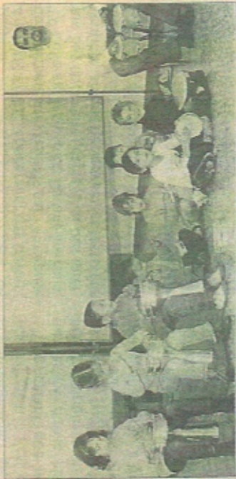
Les enfants ont apprécié la découverte des instruments.