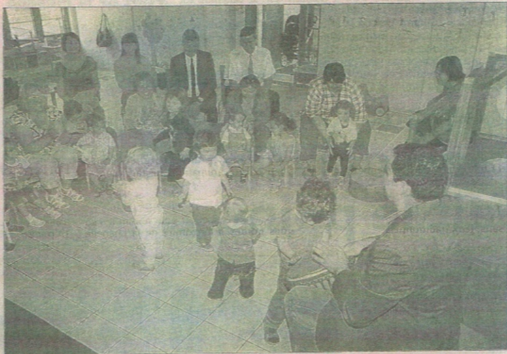
Le jardin musical permet à l'enfant de développer ses facultés potentielles.

Le musicien intervenant propose l'apprentissage des jeux de doigts et de mains, la