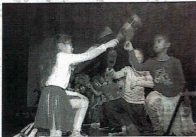
Ultime répétition, les enfants s'appliquent pour que tout soit parfait.