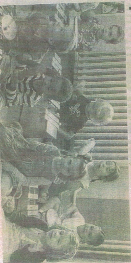
Samedi 19 mai, les portes seront spécialement ouvertes aux tout-petits à l'Emari du Sablon et de Montigny.

➤ Contact au 03 87 66 94 93 ou par mail à emari@neuf.fr